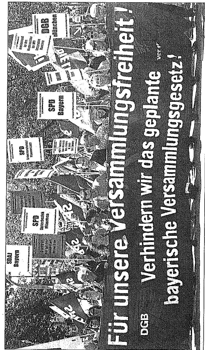
Demo gegen das neue bayerische Demo-Gesetz: Gewerkschaften und Vereine befürchten Behinderungen ihrer Aktionen durch den Staat

geschrieben, um kritische Bürger gängeln zu können. Jede Menge Bürokratie soll sie einschüchtern, dass sie sich ihre Meinung nicht zu sagen trauen. Bayern hat sogar wie mit der Erlaubnis von Filmaufnahmen Regeln eingearbeitet, denen das Bundesverfassungsgericht schon längst widersprochen hat. Nach dem neuen Recht sollen Nazi-Aufmärsche wie hier zum Todestag des Hitler-Stellvertreters Hess auf dem Marienplatz leichter verboten werden können.