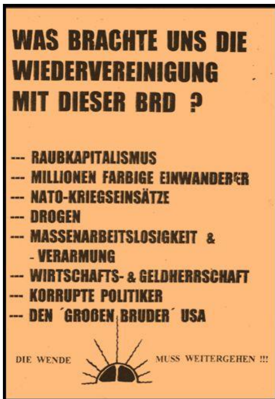
Abbildung 2: Plakat aus dem Leipziger Raum

Wenn man den Rechtsradikalismus im Freistaat Sachsen anspricht, dann sollte man nicht vergessen, dass in Reaktion auf die Vorfälle in Hoyerswerda bereits im Jahre 1991 auf Initiative des damaligen Innenministers Heinz Eggert die sogenannte „Soko Rex“ gegründet wurde, die sich mit Rechtsradikalismus befasste. Auch heute besteht diese Abteilung der Kriminalpolizei weiterhin, sie untersteht jetzt dem „Operativen Abwehrzentrum (OAZ)“. Zum Arbeitsaufkommen dieser Ermittlungseinheit berichtete ein ehemaliger Leiter, dass pro Jahr fast 600 Fälle mit einer Aufklärungsquote von ca. 90 % bearbeitet wurden. 23 Da die Fälle bisher keiner wissenschaftlichen Begleitforschung unterlagen, kann nur darüber spekuliert werden, ob es sich dabei um die Aufdeckung von rassistischen Schmierereien, Beleidigungen von Personen mit Migrationshintergrund oder um schwere Körperverletzungen, Bedrohungen oder Brandstiftungen handelte. Auch die Aufklärungsquote sagt wenig aus, wie oben erläutert. Letztendlich stehen dem OAZ in fünf regionalen Ermittlungsabschnitten insgesamt nur 65 Beamtinnen und Beamte zur Verfügung, was im Polizeialltag höchstens dafür reicht, um Ermittlungen „vom Schreibtisch aus“ zu führen und bei mehrmaligem Nicht-